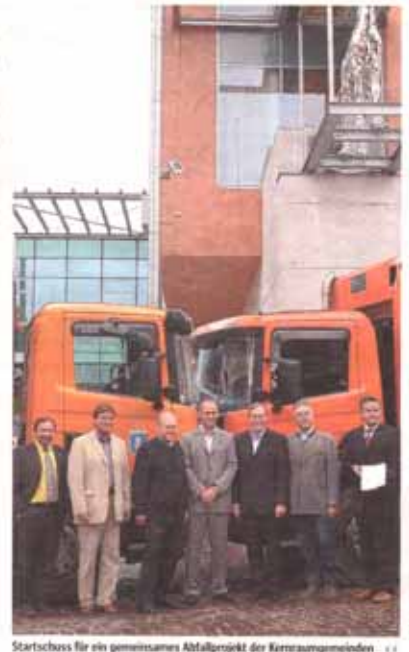
Startschuss für ein gemeinsames Abfallprojekt der Kernraumgemeinden. <1